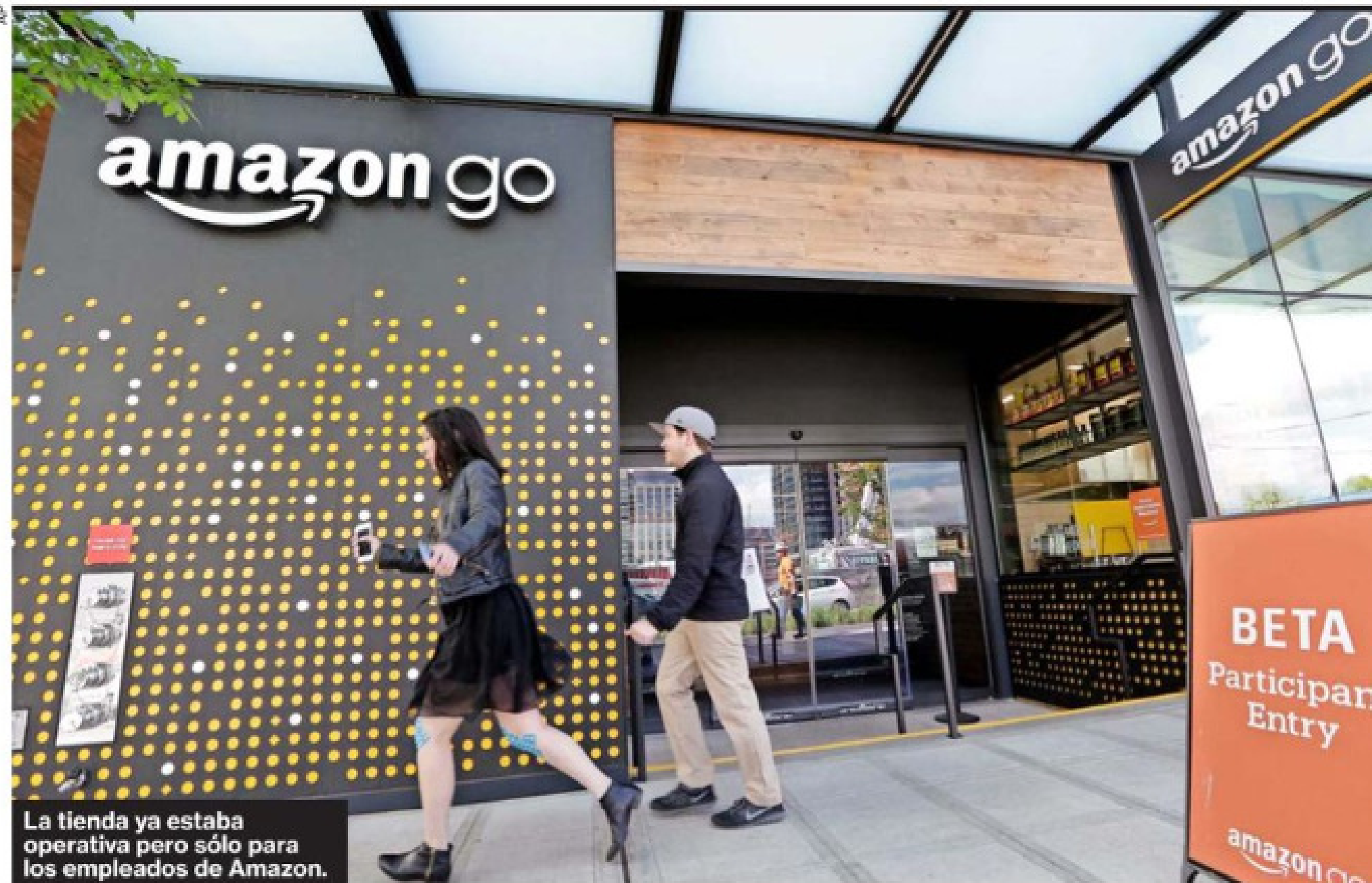
La tienda ya estaba operativa pero sólo para los empleados de Amazon.